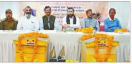
खादी एवं ग्रामोद्योग आयोग के अध्यक्ष ने मधुमक्खी पालन के जरिये आबादी में हाथियों की अबादी से रोकने का लक्ष्य भी रखा जा रहा है।

हल्द्वानी, आबादी में हाथियों की अबादी, हाथी और मक्खों को एक दूसरे से होने वाले टकराव को रोकने के लिए खादी एवं ग्रामोद्योग आयोग की ओर से हाथी गैर-आबादी प्रोजेक्ट शुरू हुआ है। इसमें खादी उत्पादों में हाथी का चित्रण को मधुमक्खी पालन से हाथियों की अबादी से रोकने का लक्ष्य भी रखा जा रहा है।