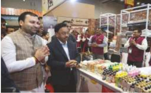
Mahatma Gandhi Ji and Hon'ble Prime Minister Shri Narendra Modi Ji, is the centre of attraction at Khadi's theme pavilion at Hall No. 3 of Pragati Maidan. The theme pavilion also depicts the core areas of Khadi, i.e. rural economy, technology, infrastructure, youth participation and global outreach, as five pillars of

The Khadi India pavilion has set-up more than 200 stalls for participation by Khadi artisans through Khadi Institutions. Units established under Prime Minister's Employment Generation Program (PMEGP) & units established under SFURTI Cluster from across the country, showcasing the finest handcrafted Khadi and Village Industry products. A sell-off point with