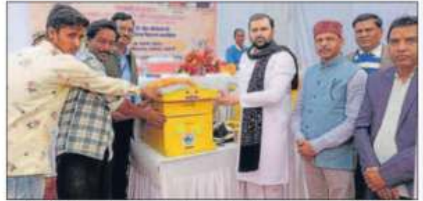
खादी ग्रामोद्योग आयोग ने चौसला फॉरिस्ट रेंज फतेहपुर हल्द्वानी में रि-हेब का शुभारंभ किया।