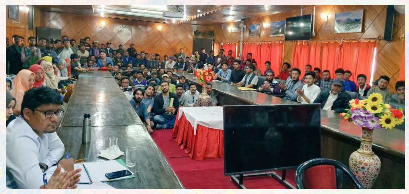
A one day awareness camp was organised on 3<sup>rd</sup> July at Kargil Ladakh division of J&K. Beneficiaries & budding entrepreneurs participated in this interactive program