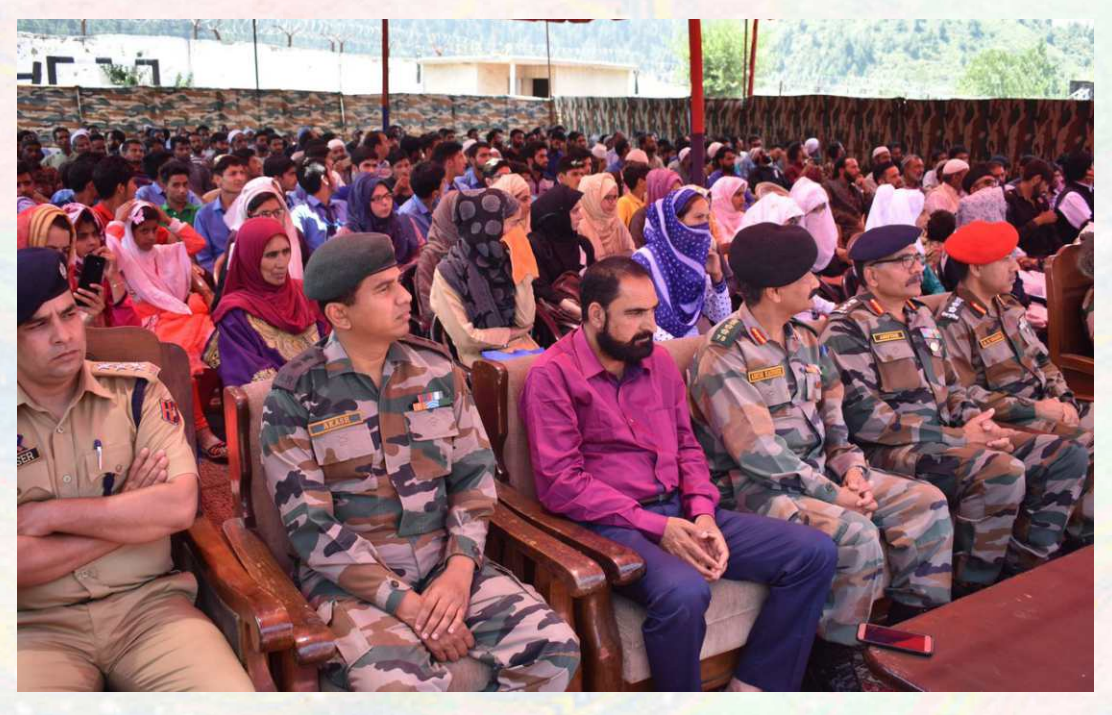
KVIC joined hands with the ADGPI in expanding the Honey Mission programme to produce high altitude honey by distributing 1,000 bee boxes to the youth of Sopore, J&K.

KVIC in association with _ADGPI organised Bee Keeping Training for the locals of Kupwara Dist. J&K Close to 100 individuals were trained in 5 batches, each batch consisting of 20 people Bee Boxes & equipment were distributed to the trainees on 17th July.