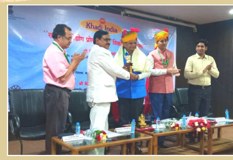
KVIC's promotional activities in Jaipur

A Monthly Journal of KVIC on Rural Industrialisation KHADI AND VILLAGE INDUSTRIES COMMISSION, MUMBAI