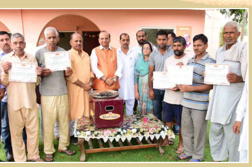
Distribution of 100 Electric Potter Wheel in remotest part of J&K