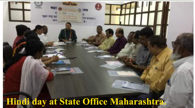
Hindi day at State Office Maharashtra.

Training and orientation workshop on PMEGP held at Ranchi on 11-01-2019.