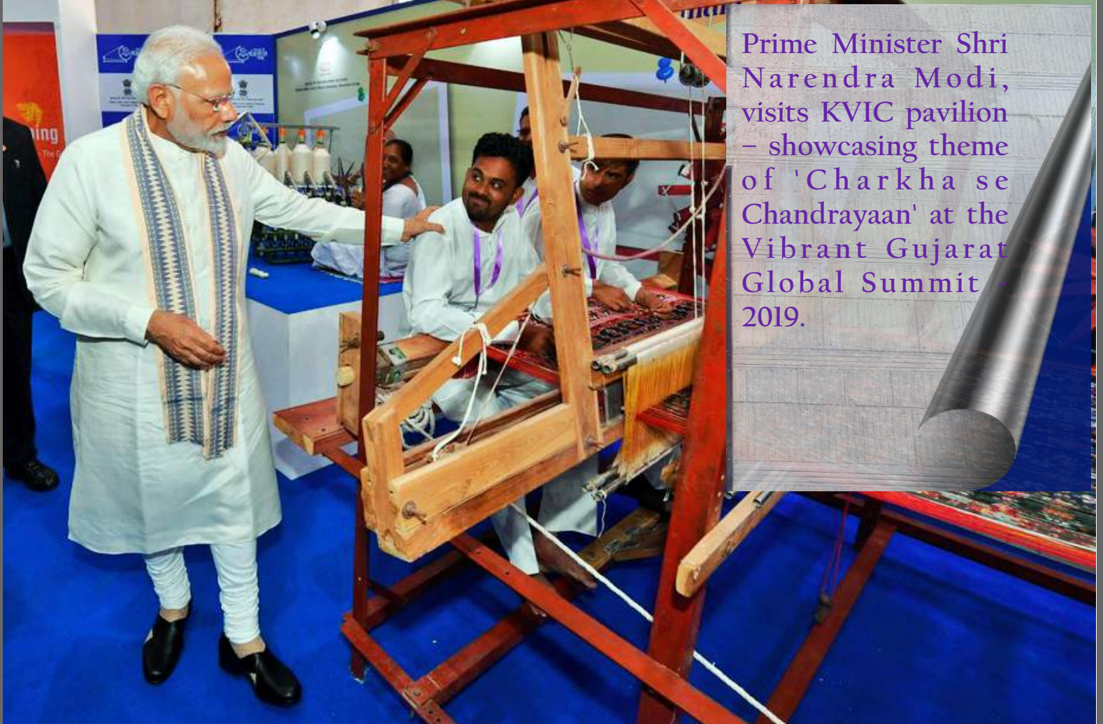
Prime Minister Shri Narendra Modi, visits KVIC pavilion – showcasing theme of 'Charkha se Chandrayaan' at the Vibrant Gujarat Global Summit 2019.