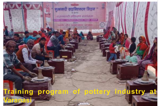
Training program of pottery industry at Varanasi