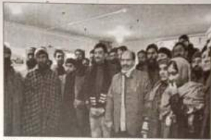
KVIC resource persons along with participants of financial assistance camp in Pampore on Wednesday.