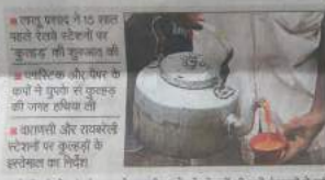
कुल्हड़ों की वापसी का फैसला किया गया है। कुल्हड़ों को वापस आने के 15 साल पहले के कुल्हड़ों को 'कुल्हड़ों' की वापसी का फैसला किया गया है।

■ भावा में हिस्से : रेलवे स्टेशनों पर कुल्हड़ों को वापस आने का फैसला है। कुल्हड़ों को वापस आने के 15 साल पहले के कुल्हड़ों को 'कुल्हड़ों' की वापसी का फैसला किया गया है। कुल्हड़ों को वापस आने के 15 साल पहले के कुल्हड़ों को 'कुल्हड़ों' की वापसी का फैसला किया गया है। कुल्हड़ों को वापस आने के 15 साल पहले के कुल्हड़ों को 'कुल्हड़ों' की वापसी का फैसला किया गया है।