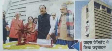
वाइस प्रेजिडेंट ने किया उद्घाटन