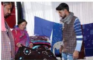
साँकार। खादी और ग्रामोद्योग आयोग दिल्लीजन कार्यालय बीकानेर द्वारा सनी महारा में 15 जनवरी तक चलने वाली प्रदर्शनी में युवाएं कप से जैकेट, लेडीज शॉल व पट्टू काशी आकर्षण का केंद्र बन चुकी है। साथ ही मुर्ती उनी एवं राश्या खादी के अन्य कपड़े भी लोगों को प्रभावित्र कर रहे हैं।

ऊनी लेडीज शॉल, पट्टू व जैकेटों की बिक्री जोरों पर