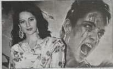
Bollywood actor Kangana Ranaut poses for photographers during a special screening of her upcoming film 'Manikarnika' in Mumbai.