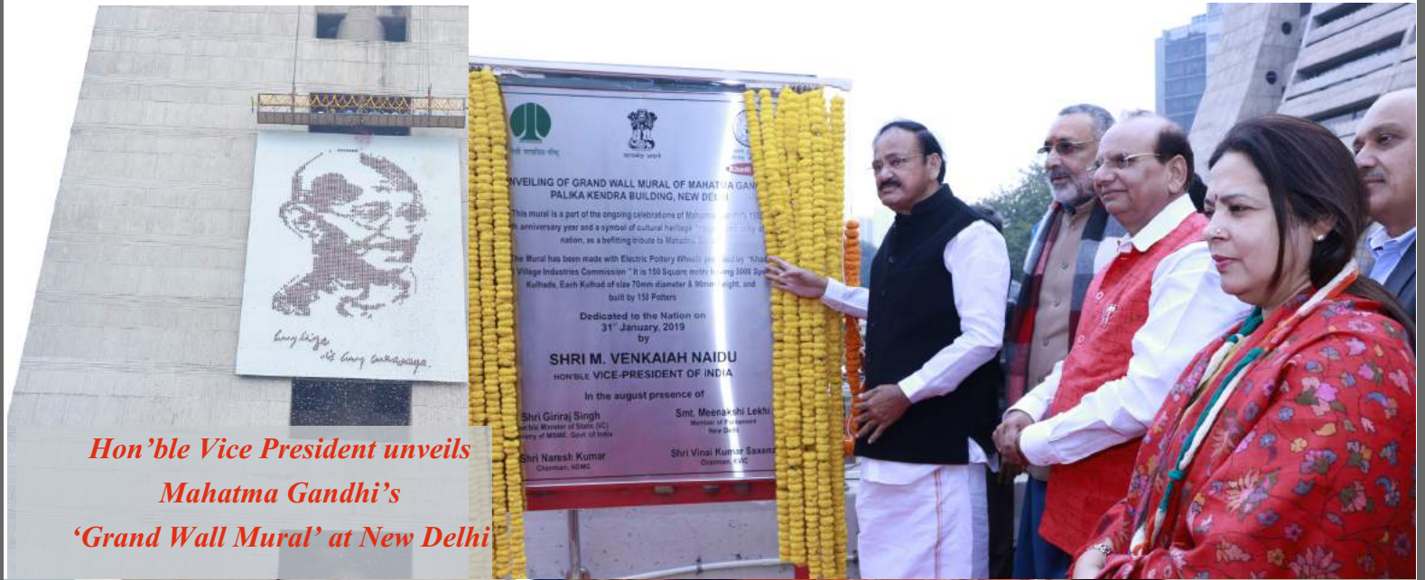
Hon'ble Vice President unveils Mahatma Gandhi's 'Grand Wall Mural' at New Delhi