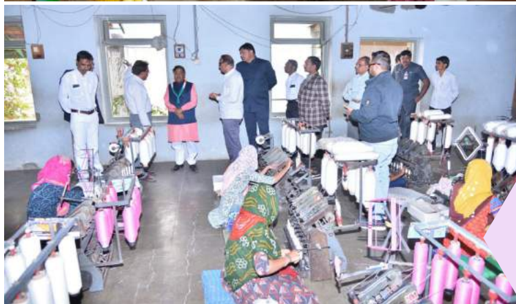
Revenue minister, Govt. Of Gujarat Shri Kaushikbhai Patel visited on 26 January at Udyog Bharti Gondal appreciated the khadi work.