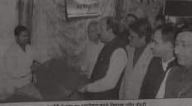
प्रदर्शनी में खादी का अवलोकन करने किसान और वीपी