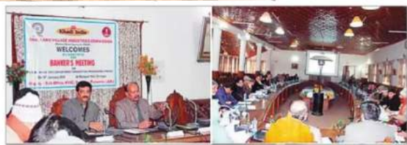
श्रीनगर में के.वी.आई.सी. द्वारा आयोजित बैठक में भाग लेते बैंकर।