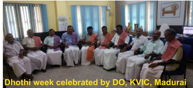
Dhoti week celebrated by DO, KVIC, Madurai