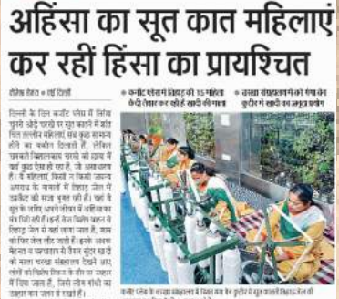
दिल्ली के गिरावट पर 10 प्रतिशत के अहिंसा का सूत कात महिलाएं कर रहीं हिंसा का प्रायश्चित