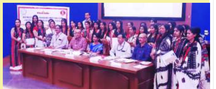
Vice Chairman National Commission for SC reviewed PMEGP program , and handed over loan sanction order to a SC beneficiary under PMEGP.