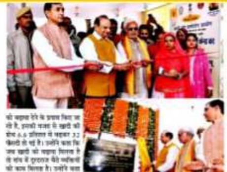
खादी एवं ग्रामोद्योग आयोग के अध्यक्ष विनय कुमार सक्सेना बुधवार को खादी एवं ग्रामोद्योग आयोग के बहुउद्देश्यीय प्रशिक्षण केन्द्र के उद्घाटन एवं इलेक्ट्रिक चॉक एवं न्यू मॉडल चरखा वितरण कार्यक्रम के दौरान मुख्य अतिथि के रूप में यह बात कही।

खादी एवं ग्रामोद्योग आयोग के विधायक विनय कुमार सक्सेना ने कहा कि गांधीजी की यह विचारधारा आज भी प्रासंगिक है। खादी वस्त्रों के पहनने में जीवन के लिए जरूरी पानी की छाना अल्प मात्रा में होती है और इससे हमारे समाज को चरमतरिक प्रतिभाओं को रोजगार भी मिलता है इसलिए युवाओं को खादी वस्त्रों का उपयोग करना चाहिए।