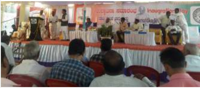
State office, KVIC Hubballi organised a State Level Exhibition at Hubballi. Exhibition was inaugurated by Hon'ble Minister Govt. of Karnataka Shri C. S. Shivalli Govt. of Karnataka MP Shri Pralhad Joshi present in the event.