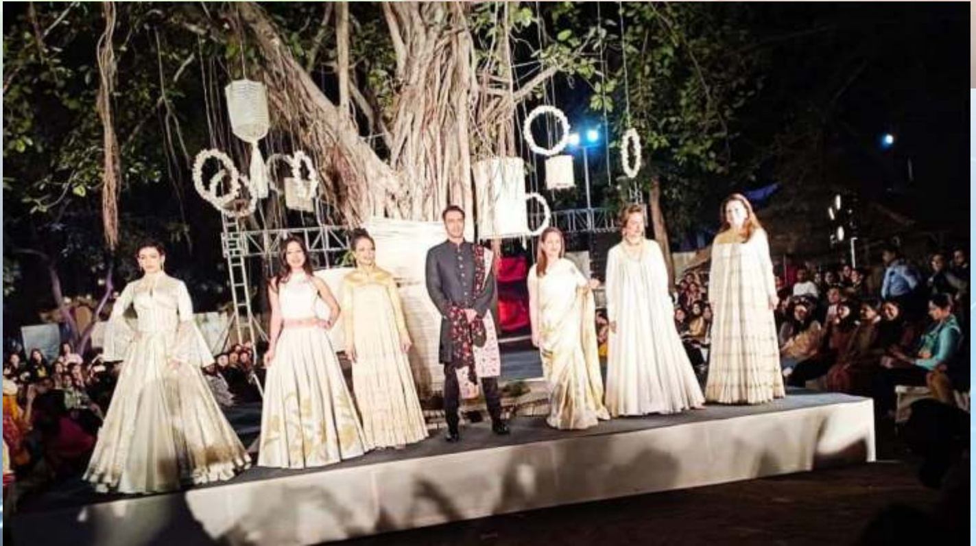
"Khadi Goes Global" Conclave encapsulated the journey of Khadi from Freedom to Fashion, from Ethnic to Chic. Designers rohitbal and AJSK officials showcased stunning Khadi collection & ensembles elegantly displayed on the ramp.