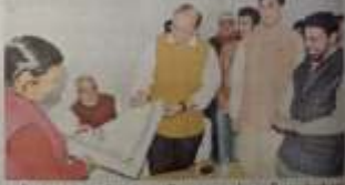
खादी एवं ग्रामोद्योग आयोग के अध्यक्ष विनय कुमार सक्सेना खादी वस्त्रों को पहनने में मदद मिलती है।

विनय कुमार सक्सेना ने बोली। उन्होंने बताया कि भारत सरकार के उद्यम एवं मंत्रालय के खादी एवं ग्रामोद्योग आयोग के अध्यक्ष सक्सेना ने गांधी मैदान में चल रही प्रदर्शनी का अवलोकन किया। उन्होंने कहा कि खादी हमारे स्वास्थ्य के लिए अनुकूल होने के साथ ही स्वयं राष्ट्रीयता की शान भी है। उन्होंने कहा कि खादी के कपड़े पहनने में जीवन के लिए जरूरी पानी की छाना अल्प मात्रा में होती है और इससे हमारे समाज