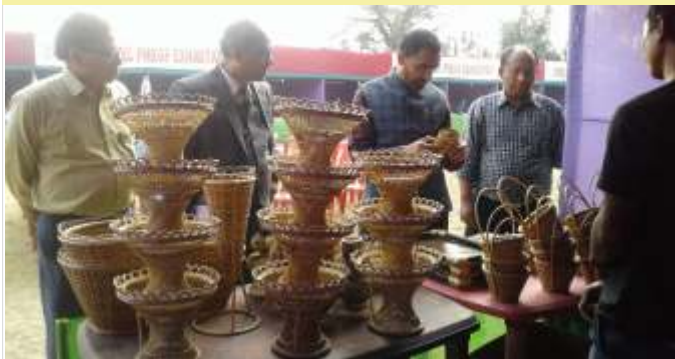
State level PMEGP Exhibition inaugurated by Dy. Commissioner, Williamnagar . The exhibition was from 5th to 14th February, 2019.