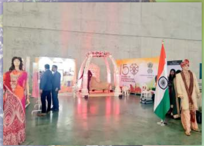
Showcasing Khadi at Fashion of Multicultural Australia Exhibition.