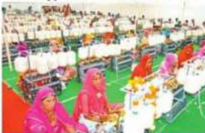
बाड़मेर में खादी के तारों को तैयार करने के लिए एक विशेष कार्यक्रम का आयोजन किया गया है।

बाड़मेर में खादी के तारों को तैयार करने के लिए एक विशेष कार्यक्रम का आयोजन किया गया है। इस कार्यक्रम में खादी के तारों को तैयार करने के लिए एक विशेष कार्यक्रम का आयोजन किया गया है। इस कार्यक्रम में खादी के तारों को तैयार करने के लिए एक विशेष कार्यक्रम का आयोजन किया गया है।