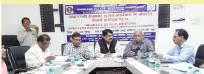
Banker's Review meeting under PMEGP Scheme organised at Raipur. Chhattisgarh.