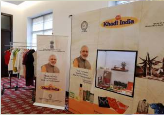
As part of 150th birth anniversary of Mahatma Gandhi, KVIC organised an exhibition of Khadi products in Kabul.