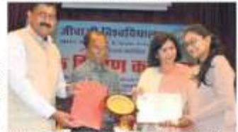
जेयू में आयोजित प्रतियोगिता में कॅटिबिबेर की छात्राओं को पुरस्कार देने की छवि।

विद्युत के तारों के बिना खादी अनुसरण है। इसकी वजह है कि आज विश्वभर में अखंडता का महत्व बढ़ रहा है। ऐसे में खादी को विश्व को आनंद देना, जो वैश्विक स्तर पर खादी को अग्रणी बना दे सके।