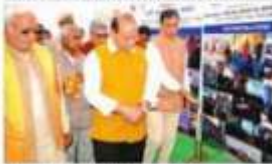
अंतर व जैरा उत्पादकों को देने की योजना का उद्घाटन किया गया है।

अंतर व जैरा उत्पादकों को देने की योजना का उद्घाटन किया गया है। इस योजना के तहत खादी के तारों को तैयार करने के लिए एक विशेष कार्यक्रम का आयोजन किया गया है।