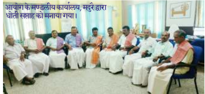
आयोग के मण्डलीय कार्यालय, मदुरै द्वारा धोती सप्ताह को मनाया गया।