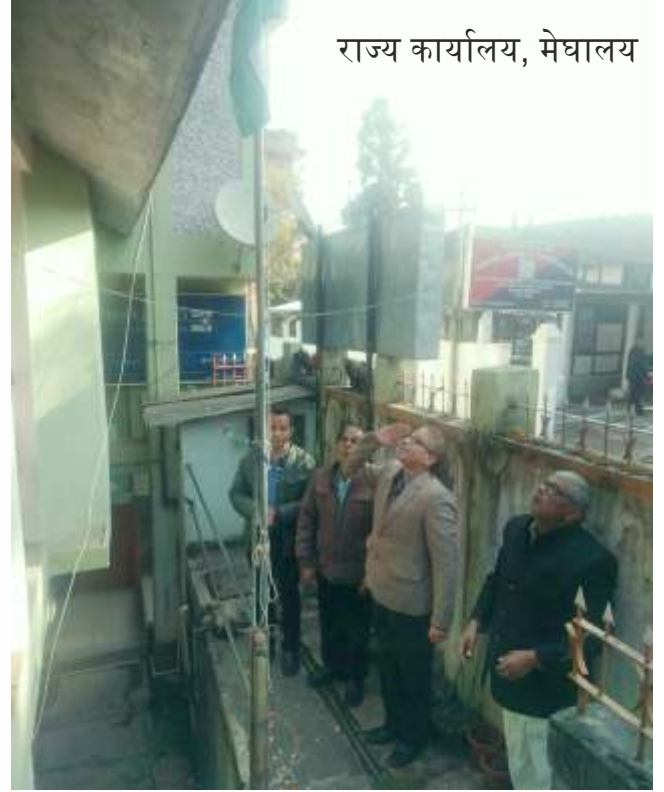
राज्य कार्यालय, मेघालय