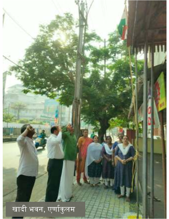
खादी भवन, एर्णाकुलम