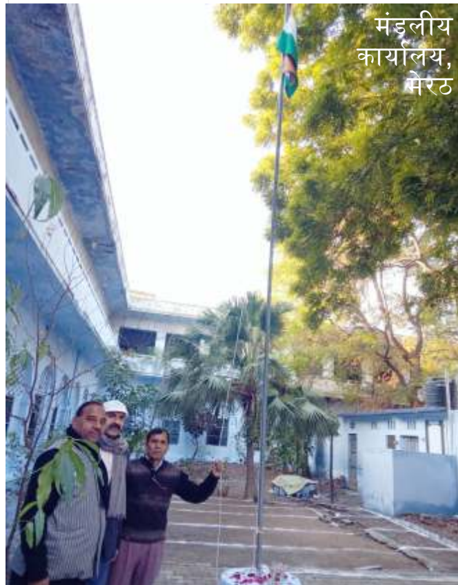
मंडलीय कार्यालय, मेरठ