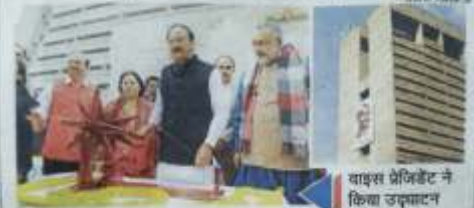
वाइस प्रेजिडेंट ने किया उद्घाटन