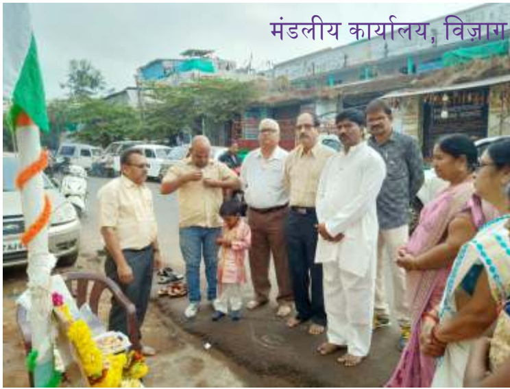
मंडलीय कार्यालय, विजाम