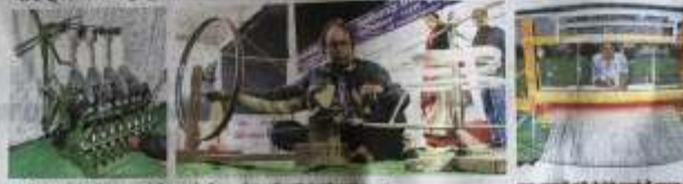
खादी प्रोसेस के चारों चरणों का सारांश: कपास की रूई से धागा बनाना, धागा तानना, धागा बुनना और धागा सेना करना।

खादी एवं ग्रामोद्योग आयोग के खादी सेने ने पहलुएं देशभर के बुलकर, एक्सपर्ट्स से बात कर हज़ार बता रहे हैं कपास से खादी बनने तक की पूरी प्रोसेस, पढ़िए खास रिपोर्ट