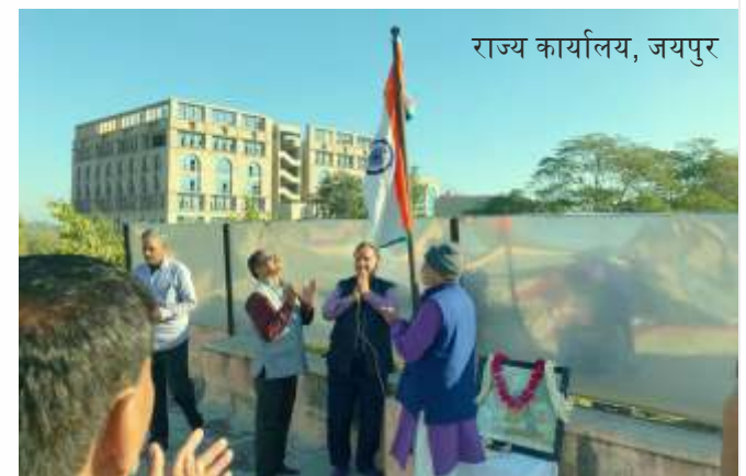
राज्य कार्यालय, जयपुर