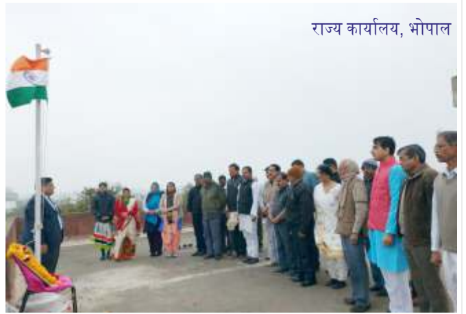
राज्य कार्यालय, भोपाल