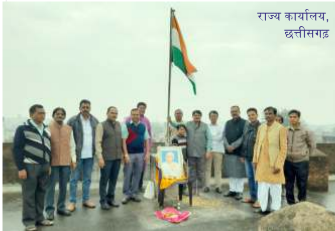
राज्य कार्यालय, छत्तीसगढ़