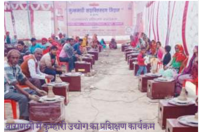
वाराणसी में कुम्हारी उद्योग का प्रशिक्षण कार्यक्रम

कोल्सिया, जिला झुंझुनू, राजस्थान में 12 जनवरी, 2019 को मधुमक्खी बक्से सहित उपकरण किट वितरण किये गये।