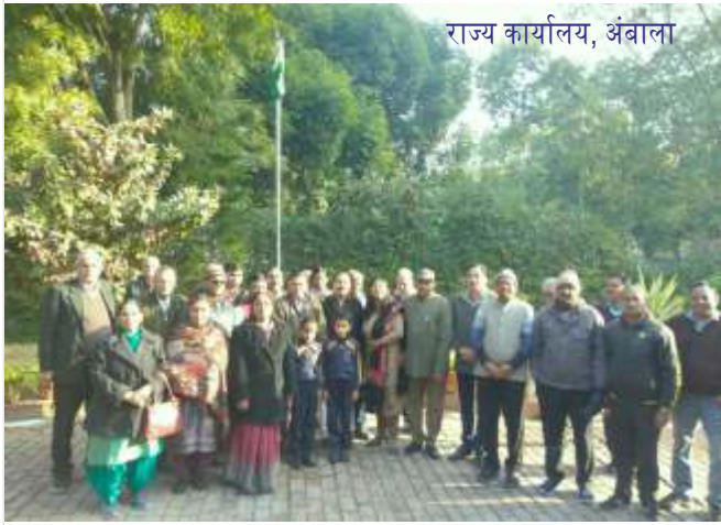
राज्य कार्यालय, अंबाला