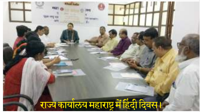
राज्य कार्यालय महाराष्ट्र में हिंदी दिवस।

तूतीकोरिन में जिला स्तरीय जागरूकता शिविर का आयोजन किया गया। शिविर में आयोग के मण्डलीय निदेशक प्रभारी, मदुरै; क्षेत्रीय प्रबंधक, पीजीबी, जिला प्रमुख प्रबंध; महा प्रबंधक, जिला उद्योग केन्द्र, एमएसएमई-डीआई; खादी ग्रामोद्योग मंडल एवं आरसेटी के पदधिकारियों ने भाग लिया है। शिविर में 145 लाभार्थियों ने भाग लिया।