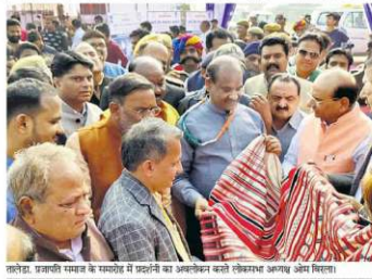
समारोह, तालेडा के पास श्रीयादे माता प्रजापति समाज के मंदिर परिसर में बांटे विद्युतचलित चाक गांव आत्मनिर्भर होगा तभी देश आगे बढ़ेगा: बिरला

समाज कार्यकर्ता गांव आत्मनिर्भर होगा तभी देश आगे बढ़ेगा: बिरला