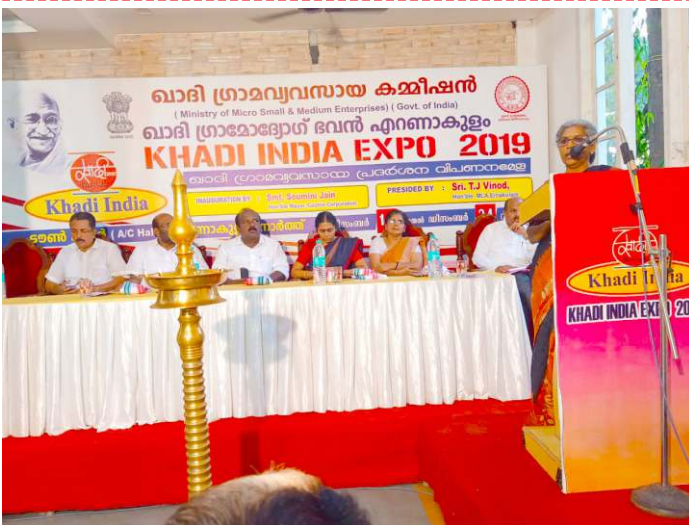
DSO Special Exhibition by K.G Bhavan inaugurated by Kochi Mayor at Town Hall Ernakulam.