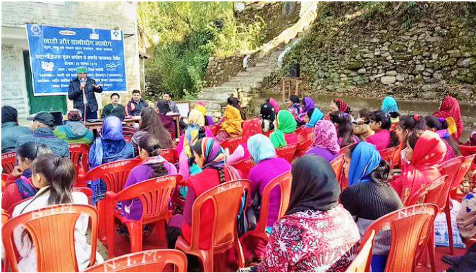
KVIC is playing a proactive role in orienting the unemployed youth towards entrepreneurship. KVIC, Dehradun organised PME GP awareness camps On 2nd December, 2019.