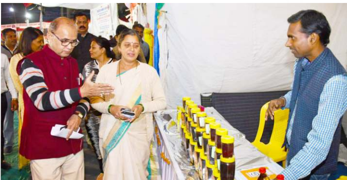
State level exhibition organized by State Office Bhopal at Jabalpur on 24th December 2019.