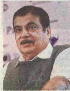
Nitin Gadkari, MSME Minister

'If people get jobs in rural areas, then they will not have to go elsewhere'