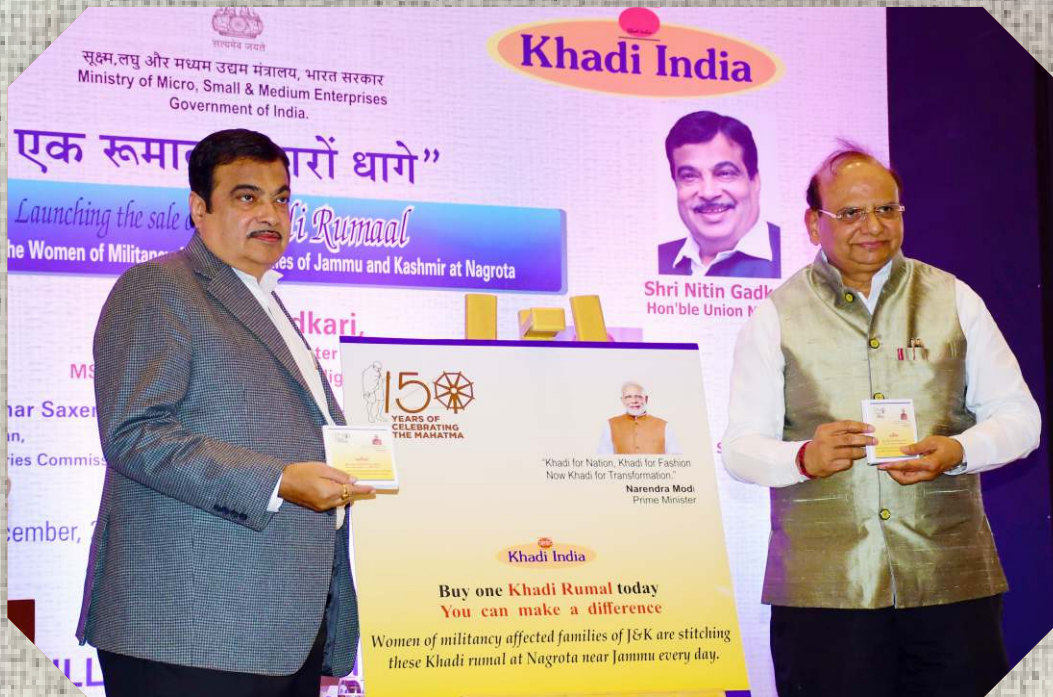
Minister MSME launches Khadi Rumaal stitched by women in militancy affected areas residing in J&K