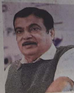
Nitin Gadkari, MSME Minister

'If people get jobs in rural areas, then they will not have to go elsewhere'