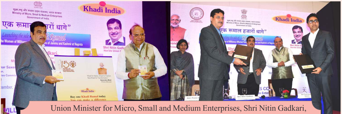
Union Minister for Micro, Small and Medium Enterprises, Shri Nitin Gadkari, launched the Khadi Rumal on 16th December at New Delhi, in the presence of Shri Pratap Chandra Sarangi, Minister of State, and Shri V.K. Saxena, Chairman, Khadi and Village Industries Commission (KVIC).

Made by militancy affected women of Nagrota, in Delhi on 16 th December