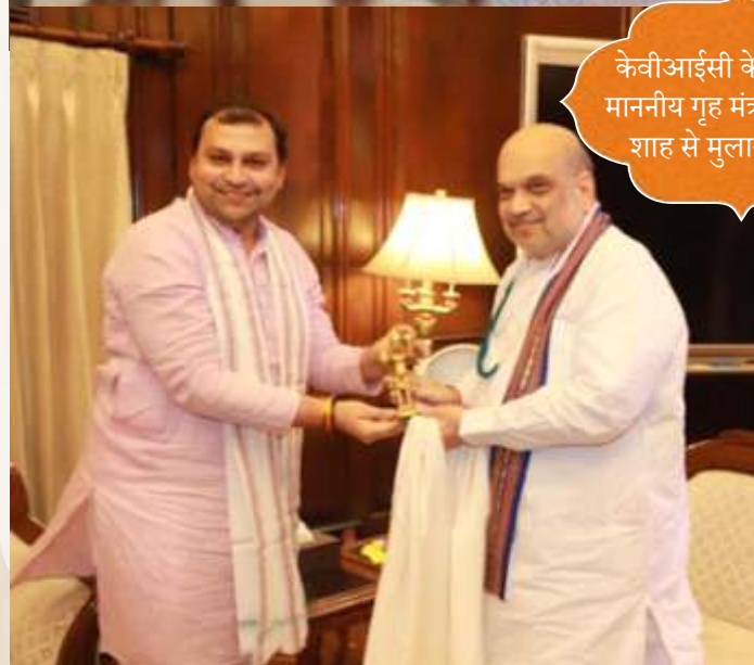
केवीआईसी के अध्यक्ष ने माननीय गृह मंत्री श्री अमित शाह से मुलाकात की।