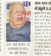
कलराज मिश्र ने यूपी में पिछले दो साल में कुल 9254 इकाइयों को सहायता प्रदान की गई है।

उन्होंने कहा कि यूपी में पिछले दो साल में कुल 9254 इकाइयों को सहायता प्रदान की गई है। इसके लिए कुल 91663 लोगों को रोजगार प्रदान किया गया है।