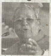
कलराज मिश्र ने रविवार को लखनऊ में मोदी सरकार को उपस्थित मिश्रों के साथ

लखनऊ (पूरनगर)। केन्द्रीय सूक्ष्म, लघु एवं मध्यम उद्यम मंत्री कलराज मिश्र ने रविवार को लखनऊ में मोदी सरकार को उपस्थित मिश्रों के साथ