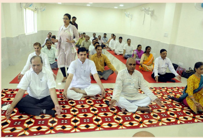
At New Delhi KGB Bhavan, New Delhi observes Yoga Day.