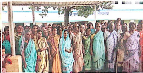
up apiculture and Khadi activities right in their native villages. The programme will also stop villagers from collecting honey and fishing in deep waters of the Sunderban forest for eking out bread for their families - risking their lives - prey to tigers, crocodiles and poisonous snakes.