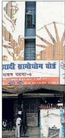
The Khadi Bazaar at Gandhi Maidan in Patna.