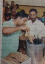
Khadi & Village Industries Commission had sponsored the training programme for 25 participants but