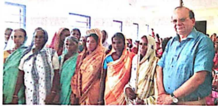
Vinai Kumar Saxena, Chairman, KVIC visited Ball Island of Sunderban to launch a training centre - 'Tiger Victim Khadi Katal Kendra' Balli for all the victims who suffer the loss of their husbands

"We want to bring down human deaths due to tiger attack to zero. Keeping this in mind, we will help villagers in taking up apiculture and weaving in all possible forms right in the villages so that they do not need to venture deep into the for-