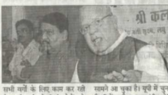
केन्द्रीय मंत्री कलराज मिश्र ने कांग्रेस को बतौरा धोखेबाज बताया।

लखनऊ। भारतीय जनता पार्टी के केंद्रीय नेता एवं केन्द्रीय सूक्ष्म, लघु एवं मध्यम उद्यम मंत्री कलराज मिश्र ने आज रात बजट का प्रशंसा और केंद्र सरकार पर निशाना साधते हुए कांग्रेस और बसपा पर निशाना साधते हुए कहा कि कांग्रेस ने देश की सभ्यता प्रगति की दिशा में नुकसान पहुंचाया है।