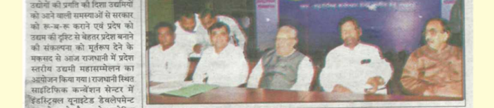
प्रदेश स्तरीय उद्यमी महसम्मेलन में लगा उद्यमियों का जमावड़ा। केन्द्रीय मंत्री रामविलास पासवान एवं कलराज मिश्र उद्यमियों की समस्याओं से हुए रु-ब-रू।

प्रदेश स्तरीय उद्यमी महसम्मेलन में लगा उद्यमियों का जमावड़ा। केन्द्रीय मंत्री रामविलास पासवान एवं कलराज मिश्र उद्यमियों की समस्याओं से हुए रु-ब-रू। प्रदेश स्तरीय उद्यमी महसम्मेलन में लगा उद्यमियों का जमावड़ा। केन्द्रीय मंत्री रामविलास पासवान एवं कलराज मिश्र उद्यमियों की समस्याओं से हुए रु-ब-रू।